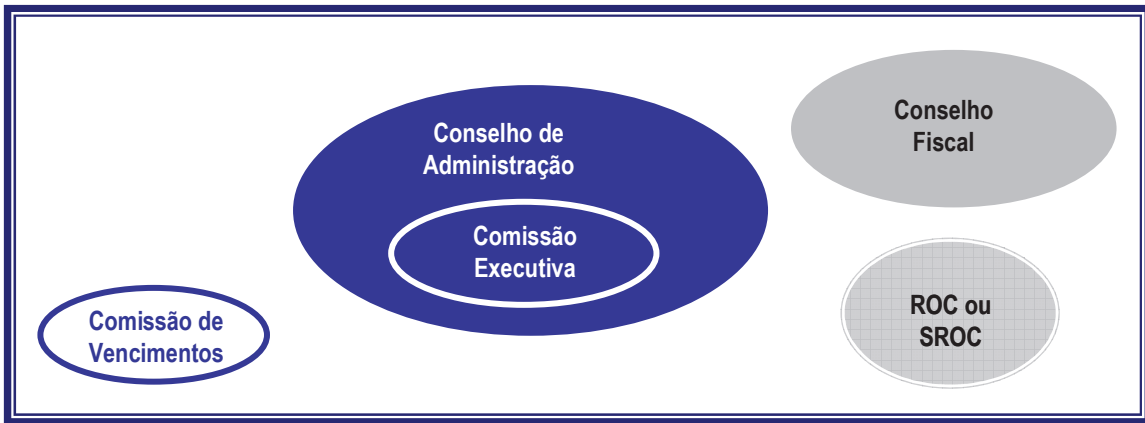
Modelo de matriz anglo-saxónica reforçado 5